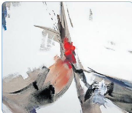
Jean Miotte, Ohne Titel, Acryl auf Leinwand, 112 x 162, 1984, © VG Bild-Kunst 2021

Auch gewährt diese Ausstellung überraschende Einblicke und neue Möglichkeiten, das Spektrum der Saarlouiser Kunstszene im gemeinsamen Austausch kennenzulernen.