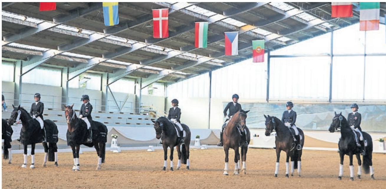
Internationale Reiterinnen und Reiter zeigten auf dem Wiesenhof hochklassigen Dressursport.

Für die unvergesslichen Momente im mehrtägigen Wettbewerb war die große Reithalle auf dem Wiesenhof mit ihren 800 Tribünen-