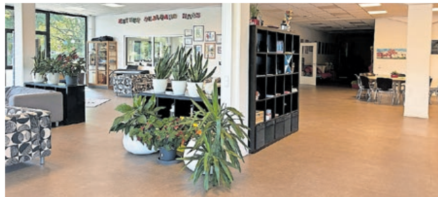
Es werden wieder „Bufdis“ für das Esther-Bejarano-Haus in Saarlouis gesucht

und Bewerber wird gerne gesehen und hilft auch den Bundesfreiwilligen selbst, sich gut in der neuen Heimat Saarlouis zu integrieren. Sie sollten Deutschkenntnisse auf B2-Niveau mitbringen. Die Bundesfreiwilligen erhalten 24 Tage Urlaub und ein Taschengeld von 330 Euro im Monat. 25 Seminartage in Saarburg sind verpflichtend. Das neue Zentrum für Kinder, Jugend und Familie versteht sich als offenes Haus für Interessierte aus allen Ländern und Kulturen. In der Einrichtung werden das ganze Jahr über, sowohl während der Schulzeiten, als auch in den Ferien