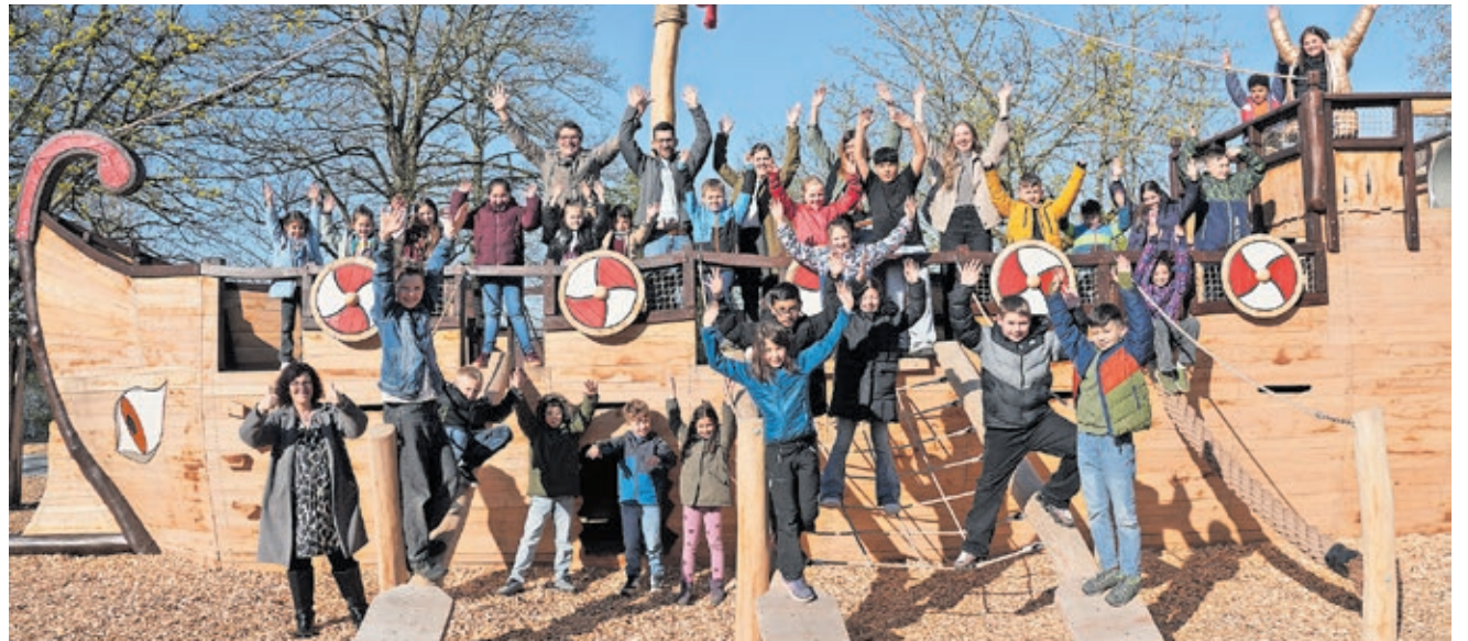
Kinder der Römerbergschule entern das neue Spielschiff gemeinsam mit der Verwaltungsspitze

Bürgermeister Carsten Quirin betont die Bedeutung solcher Investitionen: „Mit dem neuen Spielschiff schaffen wir einen Ort, an dem Kinder nicht nur spielen, sondern auch ihre Kreativität und Bewegung fördern können. Investitio-