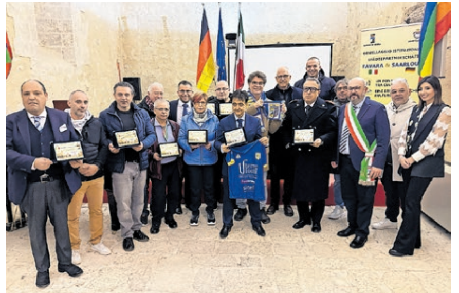
Beim Festakt wurden auch Vertreter von Vereinen und Verbänden sowie aus der Stadtpolitik beider Städte gewürdigt.