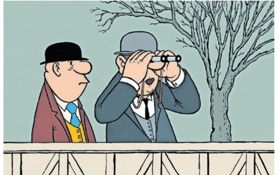
Loriot, Wo laufen Sie denn? 1972