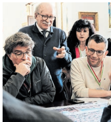
Beim Arbeitsgespräch im Rathaus von Favara wurde gemeinsam darüber gesprochen, wie die Partnerschaft in Zukunft mit Leben gefüllt werden kann.

Aus diesem Grund diente die Bürgerdelegation auch der Herstellung und Vertiefung von Kontakten – mit Vertretern aus Politik und Verwaltung, mit dem San-Giuseppe-Festkomitee oder auch mit dem Präsidenten des Freien Gemeindekonsortiums Agrigent, Giuseppe Pendolino. In Arbeitsgesprächen wurden mögliche Bereiche der künftigen Zusammenarbeit diskutiert – darunter schulische Projekte, ein wirtschaftlicher Austausch oder auch die Teilnahme an der Emmes mit einem eigenen Stand, so wie es mit den Partnerstädten Saint-Nazaire und Eisenhüttenstadt seit jeher Tradition ist.