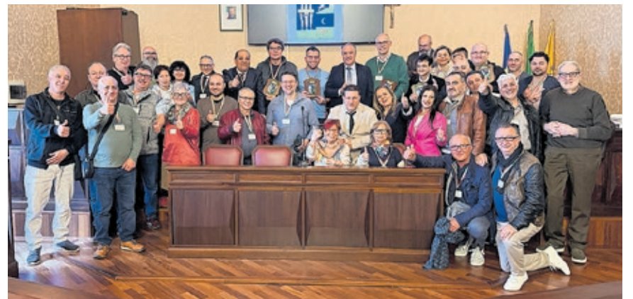
Die Bürgerdelegation zu Gast in Agrigent, der Hauptstadt des Freien Gemeindekonsortiums Agrigent, zu dem auch Favara gehört.