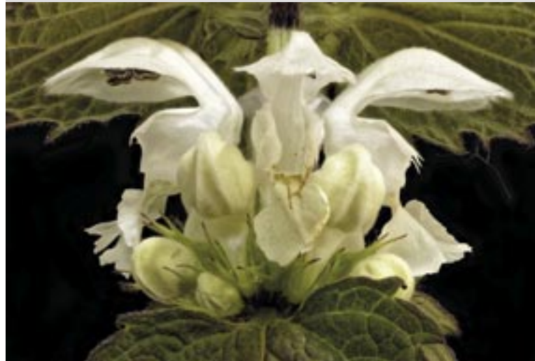
Weißes Taubnessel, 2016

Aus der langjährigen, intensiven Beschäftigung mit dieser Art von Fotografie ist eine eigene künstlerische Anschauung erwachsen, ein Konzept über die Frage, wie die