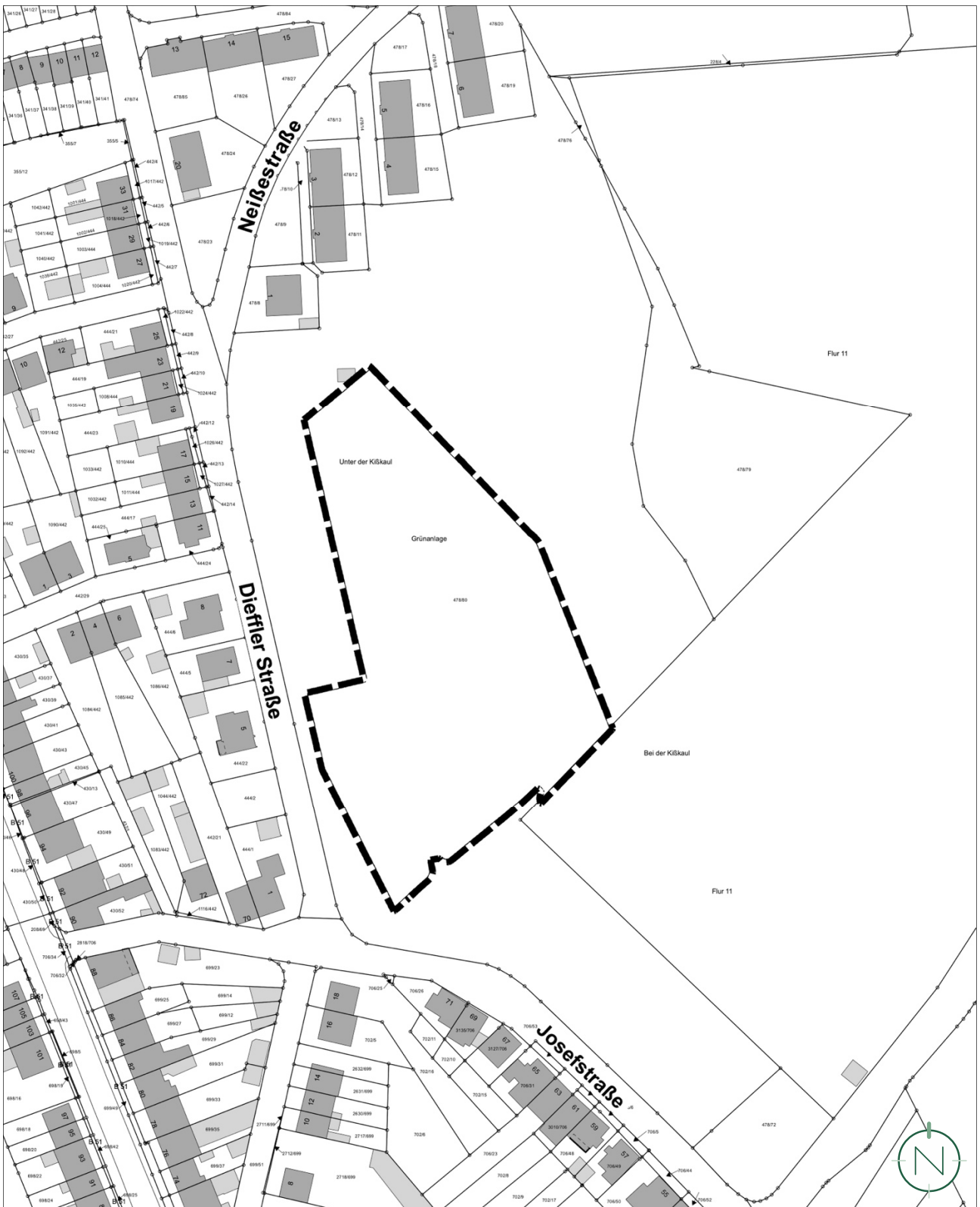
Lageplan mit Geltungsbereich der Teiländerung des Flächennutzungsplanes; Quelle: GeoBasis-DE / LVGL-SL (2026), Bearbeitung: Kernplan