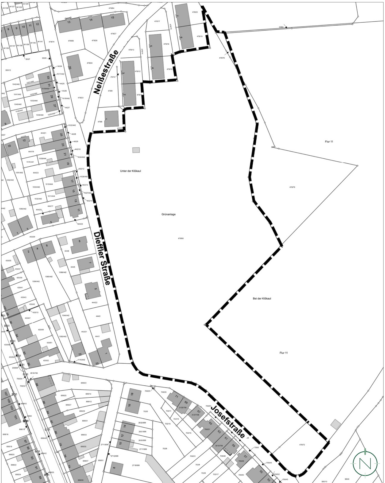
Lageplan mit Geltungsbereich Bebauungsplan; Quelle: GeoBasis-DE / LVGL-SL (2026), Bearbeitung: Kernplan