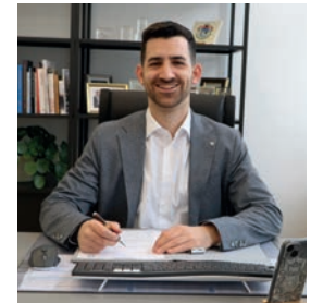
Carsten Quirin Bürgermeister